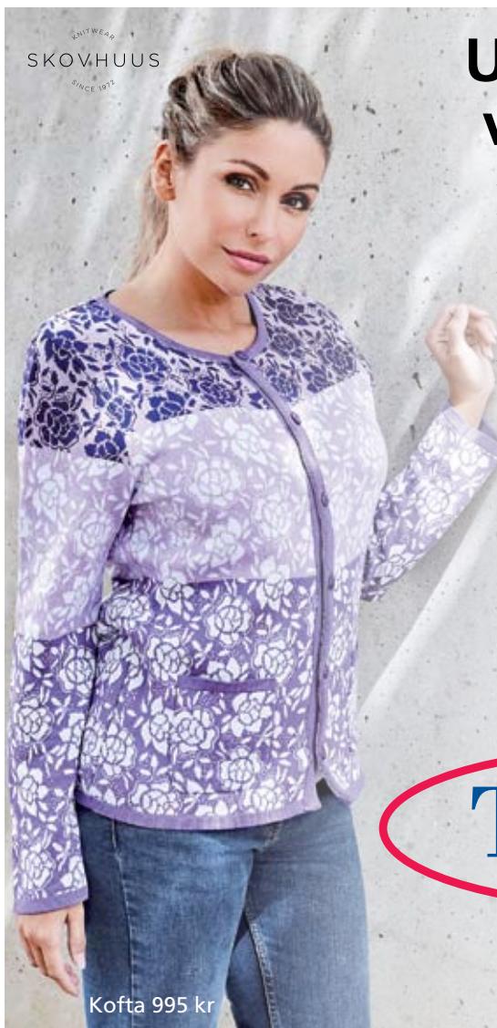
Kofta 995 kr